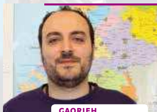
GAORIEH 32 JAAR, UIT SYRIË