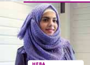
HEBA 17 JAAR, UIT SYRIË

In dit boekje komen ook deze nieuwkomers aan het woord. Wat vinden zij van Nederland?