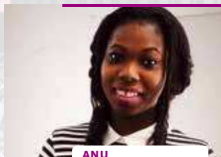
ANU 17 JAAR, UIT NIGERIA